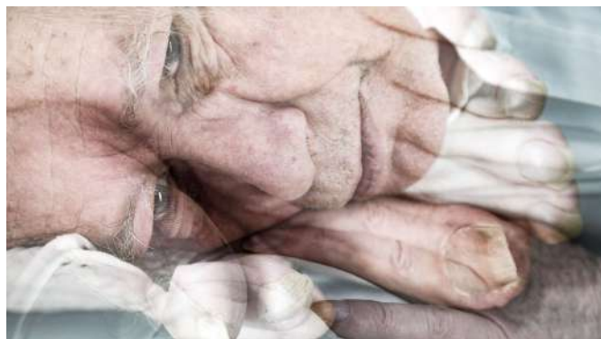
Beeld: Hanneke Wetzter