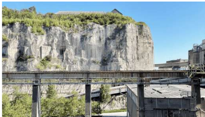
Beeld: Rademacher de Vries architecten