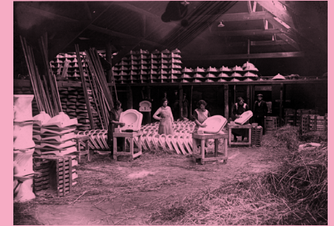
Arbeidersvrouwen uit het Boschstraatkwartier aan het werk bij De Sphinx, Maastricht, ca. 1920

Ook vrouwen met een meer bescheiden levensstandaard hebben grote invloed kunnen uitoefenen op het welzijn van hun medemens. De zusters van het Arme Kind Jezus ervoeren in de 19e eeuw de roeping om zich te ontfemen over arme kinderen en gezinnen. Om dat te kunnen doen, ontwikkelden de zusters zich zelf ook: ze bedreven hun nijverheid met zoveel verve dat hun kwaliteit wereldwijd als de top erkend werd. Het welzijn van de gemeenschap stond ook voorop bij de in Limburg alombekende Vroedvrouwschool die lange tijd het landschap bepaalde van Heerlerbaan. Aan het imposante complex van architect Jan Stuyt lagen gedegen kennis en