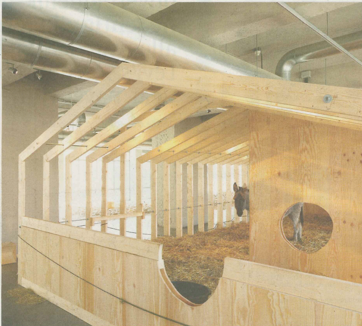
De omvangrijke installatie heeft het karakter van een compound annex kinderboerderij. In de weekeinden schuifelt er een ezel rond.