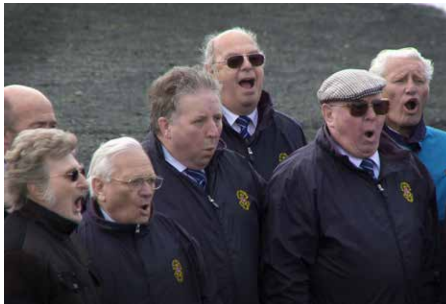
A project by Mikhail Karikis, a video by Mikhail Karikis & Uriel Orlow

Sounds from Beneath , 2011 – 2012, HD video, eenkanaals en stereo- geluid, 6'45"