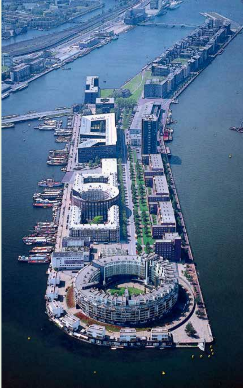
LES 1 KOESTER DE GESCHIEDENIS ALS VRIEND