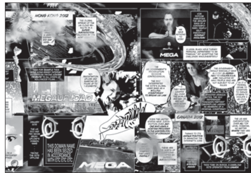
Captives of the Cloud—Scanlation (Detail)

Deze infographic toont parallele historische ontwikkelingen van en rond het begrip transparantie in politiek, architectuur en populaire cultuur.