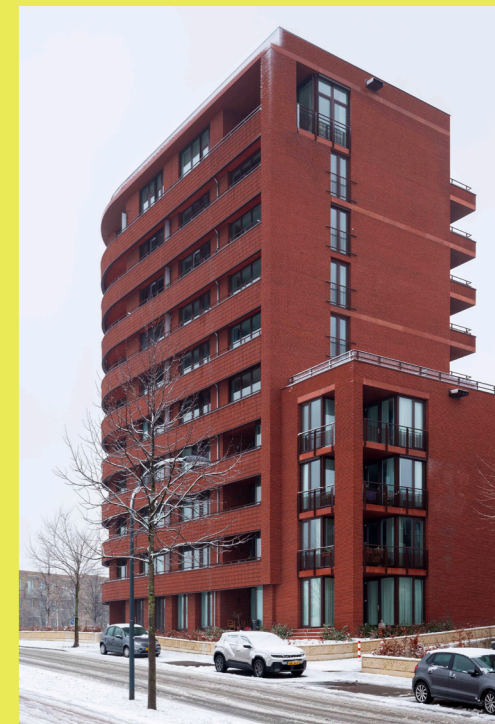
De architect is aanwezig bij De Roeije President Rooseveltlaan 18

11 Kantoor Bronsgroen Het gebouw ligt op een smalle strook tussen een tunneluitgang en de Groene Loper. De hoofdtoegang is al van verre te zien. Het zes verdiepingen hoge gebouw heeft voor een groot deel een houten draagconstructie. Het wordt met hout- en glasgevels omsloten. Tegen de zonneluifel gaat rondom een stevig klimopscherm groeien, dat in de zomer het zonlicht zal filteren en in de winter maximaal daglicht kan toelaten. Een dergelijke houten bouwstructuur is tamelijk uniek in de actuele bouwpraktijk. Al met al een opvallende verschijning.